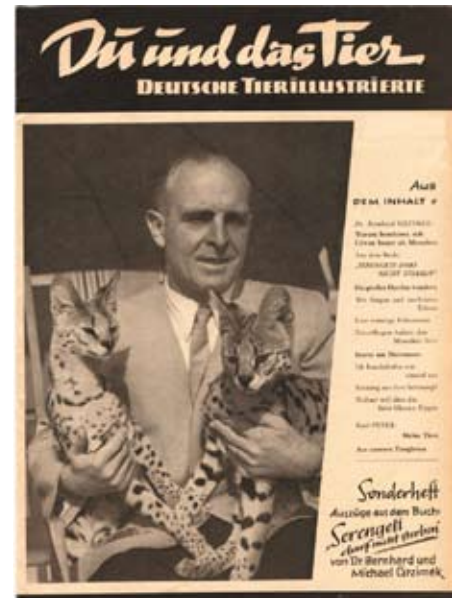
Grzimek berichtet 1959 in „Du und das Tier“ über die Dreharbeiten in Afrika und den Versuch der Filmstelle, das Löwenzitatz zu streichen.

Anfang 1970 wird Grzimek von Bundeskanzler Willy Brandt zum Beauftragten der Bundesregierung für Naturschutz berufen. Er tritt von diesem Amt jedoch bereits 1973 enttäuscht zurück, da er nicht das verwirklichen konnte, was er erhofft hatte. 1975 gründen Bernhard Grzimek, Horst Stern und 19 weitere Umweltschützer den Bund für Umwelt- und Naturschutz Deutschland. Er wird für