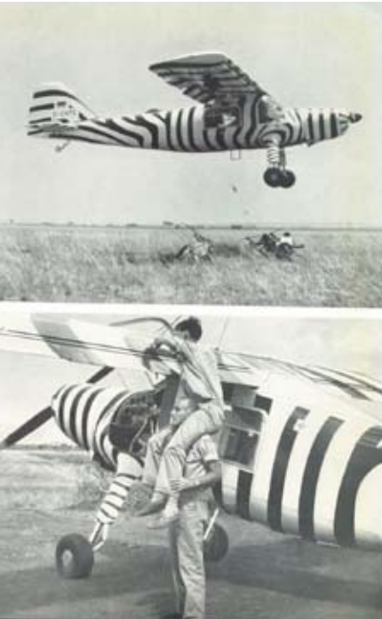
Die Dornier 27, das „fliegende Zebra“ wird zum Markenzeichen der beiden Grzimeks. Die Streifen sollten dazu dienen, das Flugzeug in der Savanne im Notfall besser finden zu können.

mit von der Partie und wird zunächst Adjutant des Oberbürgermeisters. Doch Grzimeks Herz schlägt sofort für eine andere Herausforderung: Der vollkommen in Schutt und Asche liegende Zoo, dessen Auflösung bereits beschlossene Sache ist. Es gelingt ihm mit Hilfe der alliierten Besatzungstruppen die letzten verbliebenen Tiere durchzufüttern und umzusiedeln. Und als er am 1. Mai 1945 zum Direktor des zerstörten Zoos ernannt wird, nutzt er die chaotische Lage, um von Bomben zerstörtes angrenzendes Gelände in den Zoo zu integrieren.