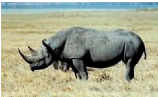
Spitzmaulnashorn in der Serengeti (Tansania)

Am Dienstag hebt in Südafrika eine Transportmaschine zu einem Flug in den 2000 Kilometer entfernten North Luangwa Nationalpark in Sambia ab. An Bord: Nashörner aus dem Kruger Nationalpark. Fünf Tiere werden in Sambia die Basis einer neuen Population bilden. Eines der imposantesten und gefährdetsten Großsäugetiere unserer Erde kehrt damit in seine ehemalige Heimat zurück. Umfangreiche Schutzmaßnahmen der Zoologischen Gesellschaft Frankfurt (ZGF) in Kooperation mit der sambischen Regierung haben in den vergangenen Jahren wieder eine Lebensgrundlage für das Spitzmaulnashorn geschaffen.