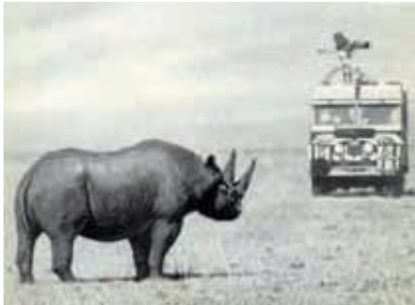
Drehtarbeiten Bernhard Grzimeks in der Serengeti in den 50er Jahren

Er war ein Mann mit Visionen, einer der Vordenker des internationalen Naturschutzes: Prof. Dr. Dr. Bernhard Grzimek. Mit seiner Arbeit in Afrika legte der ehemalige Präsident der Zoologischen Gesellschaft Frankfurt (ZGF) bereits in den 50er Jahren den Grundstein für unsere heutige Naturschutzarbeit. Sein zebra-gestreiftes Flugzeug, Buch und Film mit dem gleichnamigen Titel „Serengeti darf nicht sterben“ und die Fernsehserie „Ein Platz für Tiere“ machten ihn berühmt. Zu einem der größten Verdienste von Bernhard Grzimek zählt, dass er den Menschen die zerbrechliche Schönheit der