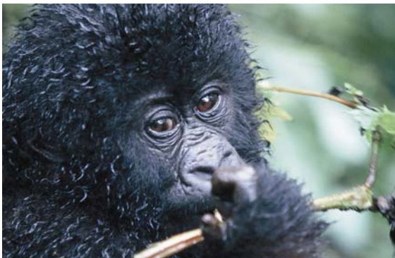
Rund 350 der weltweit 670 Berggorillas leben an den Hängen der Virunga Vulkane in der Demokratischen Republik Kongo.

In den Wäldern des Grenzgebietes zwischen der Demokratischen Republik Kongo, Ruanda und Uganda leben die letzten Berggorillas unserer Erde. Mit insgesamt etwa 670 Tieren ist der Berggorilla ( Gorilla beringei beringei ) eines der seltensten und bedrohtesten Säugetiere überhaupt. Die Hälfte der Tiere lebt an den Hängen der Virunga Vulkane in der Demokratischen Republik Kongo. Ihr Lebensraum, der Virunga Nationalpark ist UNESCO Weltnaturerbe und damit eigentlich durch internationales Recht geschützt.