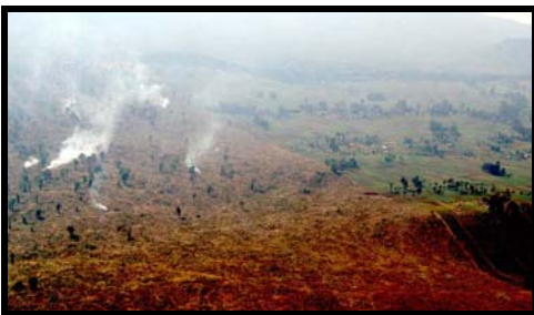
Rodungsgebiet im Mikeno Sektor des Virunga Nationalpark Mitte Juni.

die Ranger hier sehr gefährlich“, sagt Muir, der nun versuchen will, ein alternatives Kommunikationsnetz aufzubauen, um die Sicherheit der Parkranger zu erhöhen. 92 Parkangestellte wurden seit Ausbruch der ersten Unruhen 1996 getötet.